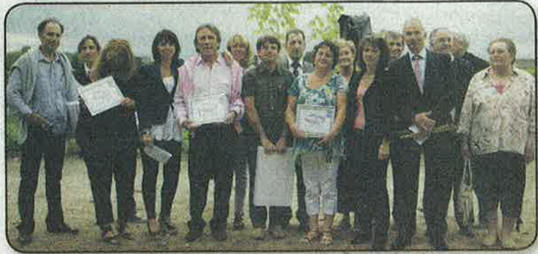
Le podium de cette 2 e édition du Rallye.

Ils étaient 41 équipages à participer samedi dernier à la grande journée « Unesco Rallye tour » organisée par la CDC de la Juridiction de Saint-Émilion et la commune de Saint-Sulpice-de-Faleyrens. Le temps d'une journée les habitants des huit communes de la Juridiction étaient invités à sillonner le territoire pour un jeu de piste ludique sur le thème du « monde du vin et vie de château », une manière de faire partager des connaissances sur l'amour du vin, le travail du vigneron, avec un regard sur la philosophie viticole côté architecture et art de