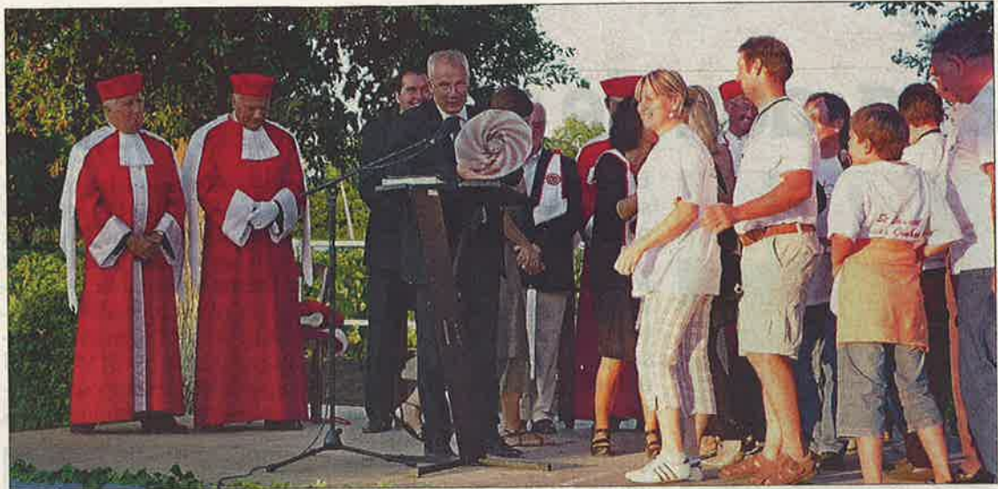
Il avait été décidé, lors de la remise des prix de la première édition du Rallye-Tour de la Juridiction, le 5 septembre 2009, qu'une nouvelle édition aurait lieu.