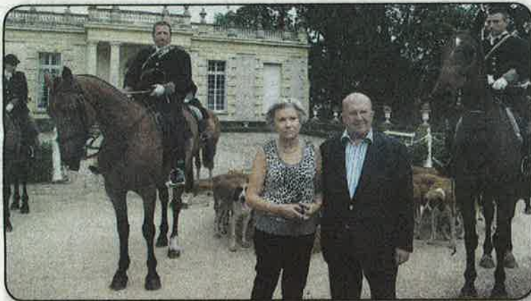
Un équipage chiens/chevaux et des sonneurs au Château Haut-Sarpe ouvert par la famille Janoueix.

Il resté encore beaucoup de trésors à découvrir pour la 3 e édition de l'Unesco Rallye tour. Le relais dans l'organisation sera pris par la commune de Saint-Émilion, désigné par tirage au sort.